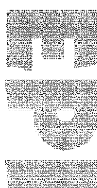
TABLA GENERAL DE TIRADA Y DIFUSIÓN